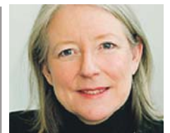
Gammeljord dirige el CCBE. NGC