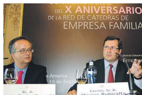
Imagen del acto celebrado por el IEF.