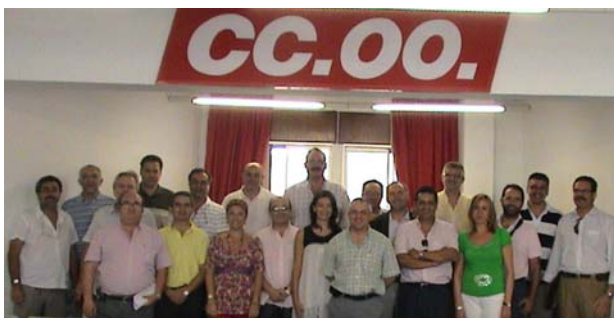
Tras recopilar durante el verano las condiciones de las Cajas y elaborar nuestra Plataforma, la Coordinadora de COMFIA-CCOO encara la negociación del ALF.

Teletipo de Europa Press sobre la constitución de la Mesa Laboral de Fusión (enlace acortado): http://rurl.org/1ymd