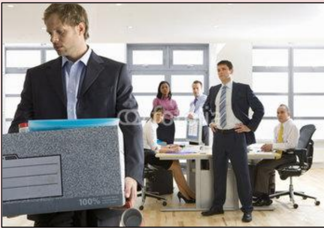
TRASLADO DE OFICINA