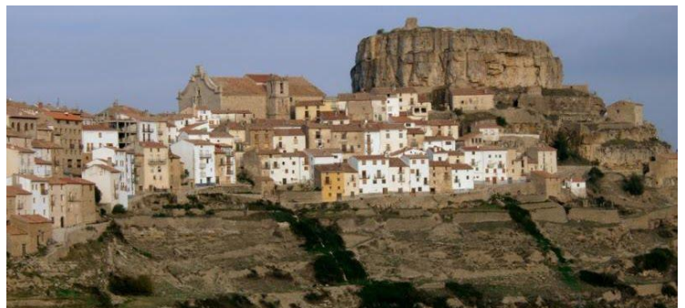
Ares del Maestrat | Castellón

Una crisis profunda como la actual, lleva aparejada cambios radicales. Cabe preguntarse qué nos ha pasado y que ha fallado. La avaricia de los mercados, la especulación financiera, la corrupción política, los hábitos de consumo, el despilfarro energético, el cambio de valores éticos, el pasotismo (cuando no complicidad) de una parte importante de la población... hace que exista una crisis social y humanitaria de escala planetaria. La insostenibilidad del sistema y el estado de colapso al que nos conduce es una realidad.