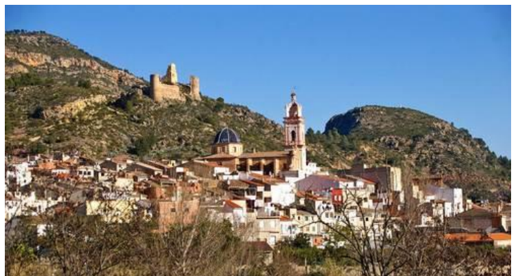
Gestaltar | Comarca de Los Serranos en Valencia

Por legítimos que sean los intereses privados, perseguir el bien común debe formar parte del nuevo orden de valores sostenibles para un futuro marco de relaciones sociales.