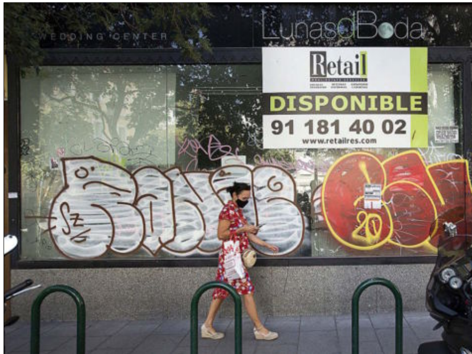
Una mujer camina frente a un establecimiento del que cuelga un cartel de «disponible», en Madrid.