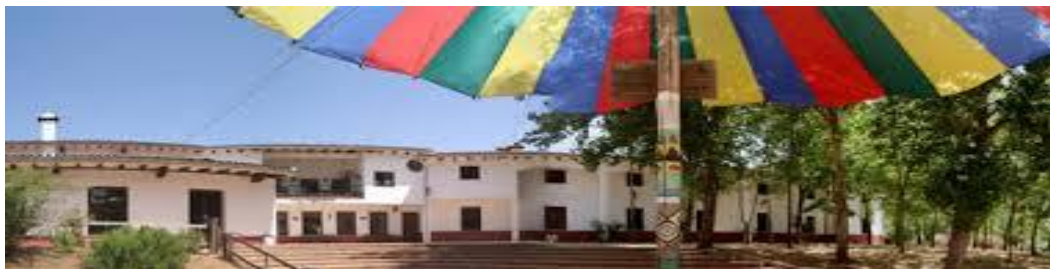
Centro de Naturaleza "El Remolino"