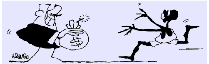
Empleado rico, empleado pobre

Lee el RD en http://www.boe.es/boe/dias/2004-06-26/pdfs/A23466-23472.pdf